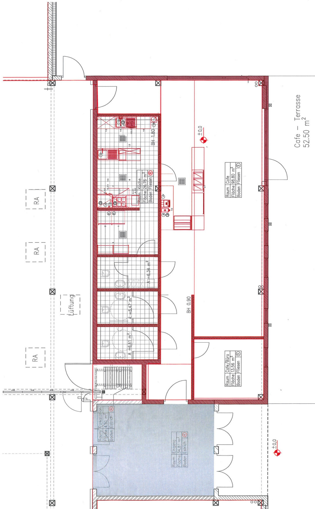
Anhang 2: Grundriss Café (unmaßstäblich)