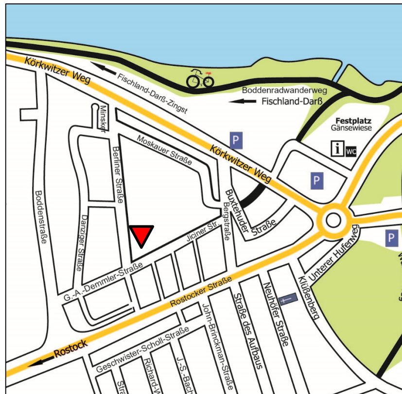
Lageplan mit Standort

Die Bernsteinstadt Ribnitz-Damgarten (ca. 15.000 Einwohner) ist ein touristisch geprägtes Mittelzentrum Mecklenburg-Vorpommerns. Die Stadt ist selbst anerkannter Erholungsort und berühmt für ihr langjähriges traditionelles Bernsteinkunsth Handwerk. Sie ist das Tor zur beliebten Urlaubsregion Fischland-Darß-Zingst und zu den nahe gelegenen Seebädern Dierhagen, Wustrow und Ahrenshoop. Ihre Lage am Bodden und vielfältige Investitionen in die Infrastruktur und in die Sanierung der Altstadtkerne haben sie in den letzten Jahren zu einem Juwel vor der Ostseeküste gemacht. Das Begegnungszentrum befindet sich im Stadtteil Ribnitz West. Eine hohe Wohndichte und zentrale Schulstandorte der Stadt prägen das Umfeld.