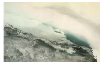
Simone Distler Überschiebung Mixed Media On Paper, 2019

Das Ausstellungsjahr in der Galerie im Kloster eröffnet die Malerin Simone Distler. Die 1882 in Unterfranken geborene Künstlerin studierte von 2009 bis 2016 an der Burg Giebichenstein Kunsthochschule in Halle / Saale. Sie lebt und arbeitet in Erdeborn, Sachsen-Anhalt. Ein wesentliches Merkmal ihrer Malerei ist die Auseinandersetzung mit der Natur. Sie beschäftigt sich mit scheinbaren Gegensätzlichkeiten wie Bewegung und Ruhe und deren Gleichzeitigkeit im Bild. Assoziationen zum Landschaftlichen werden zwar hervorgerufen, doch sucht sie immer auch Momente des Übergangs hin zu einer bloßen Ahnung.